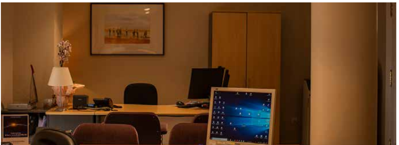
Oficinas en la tercera planta.