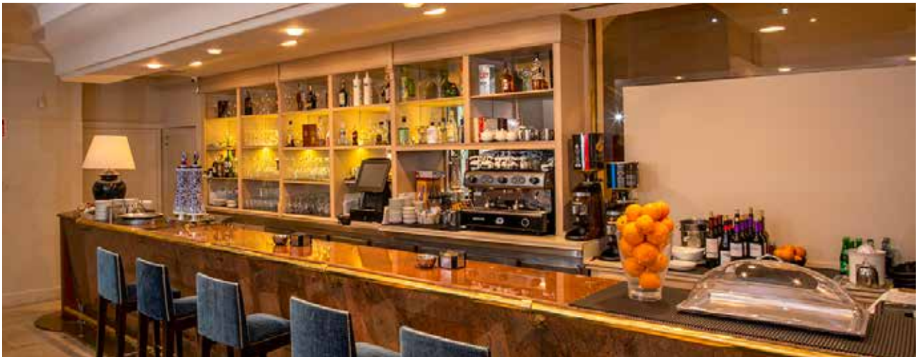
Nuestra Cafetería en Manuel Quiroga.